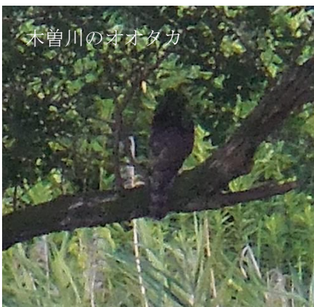
木曽川のオオタカ

愛西市観光協会では、8月の週末に木曽川で「漁業体験」を開催します。子供達を対象に、砂浜が広がる木曽川の干潟で観光船を利用した地引網、シジミ採りなど実施します。7月15日現在、定員に余裕がある週末もありますので、参加を希望されるご家族は、観光協会(0567-55-9993)へ問い合わせ下さい。