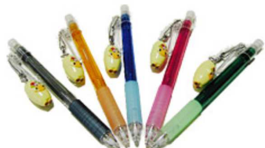
シャープペン(各色) ¥400 * 完売色あり *