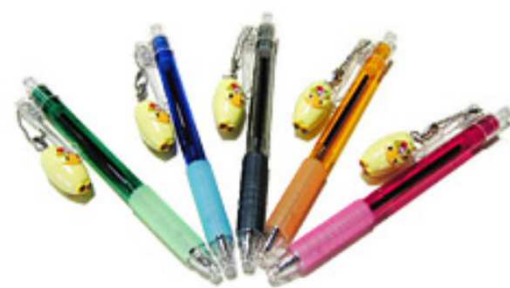
ボールペン(各色) ¥400 * 完売色あり *