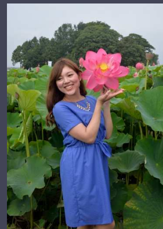
推薦【花はすを楽しむ】