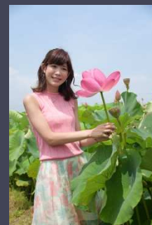
準特選【青空と花二輪】