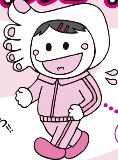
きらり☆あいらい21 運動キャラクター 「あるこちゃん」