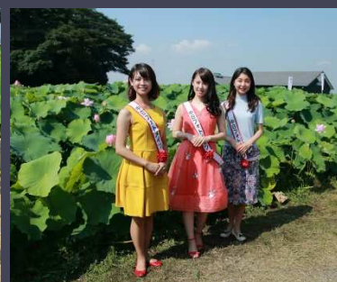
準特選【森川花はす田にて】