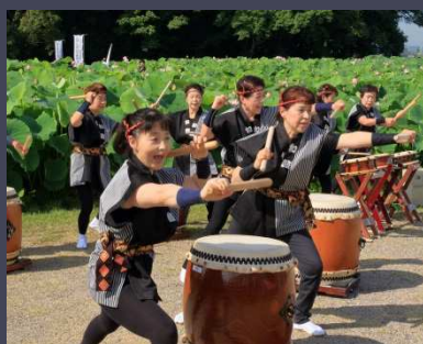
特選【みなぎる気迫】