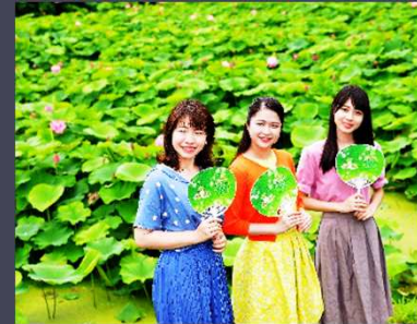
準特選【花はす田にて】