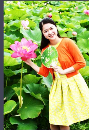
推薦【蓮の花に誘われて】